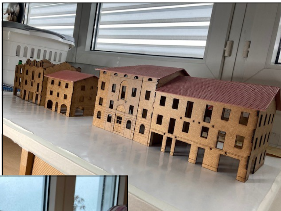
Fase 3: Assemblaggio dei singoli pezzi, stuccatura e levigatura.