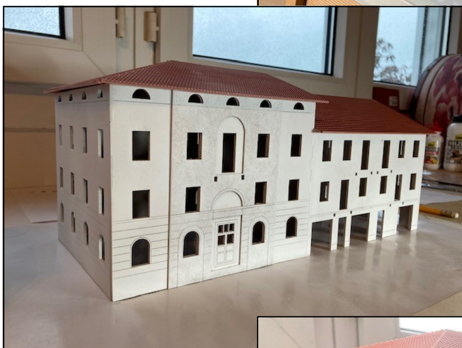
Fase 4: Verniciatura di fondo.