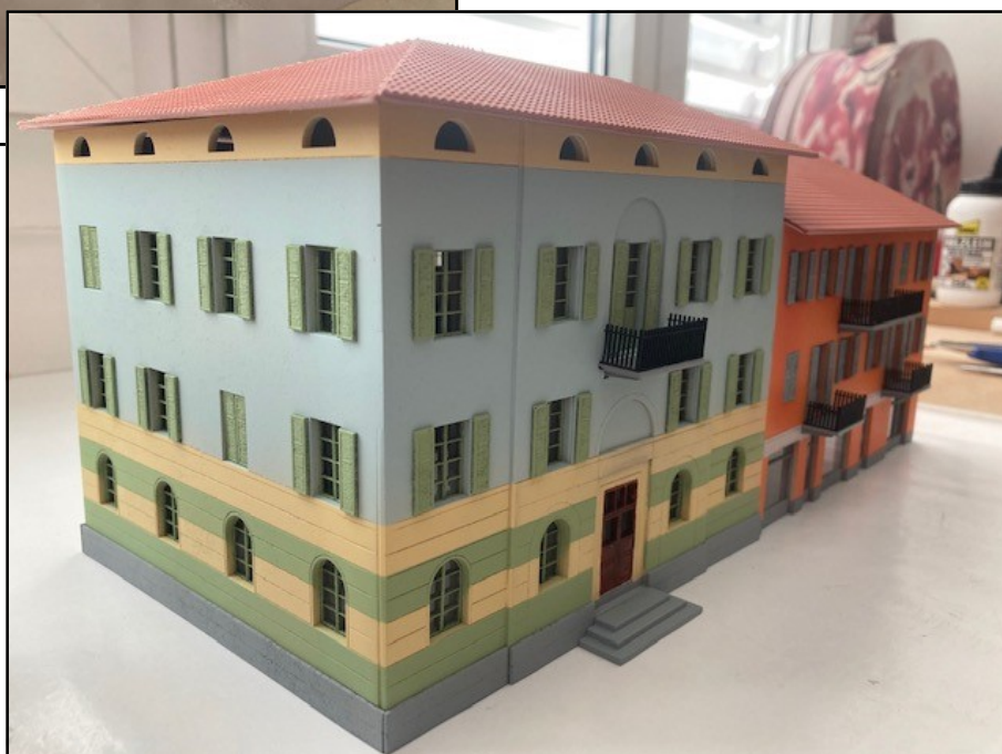
Fase 5: Verniciatura finale ed aggiunta degli oggetti accessori.