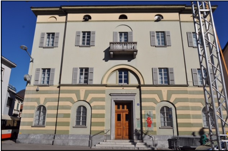
Fase 1: Fotografia dell'edificio da realizzare.